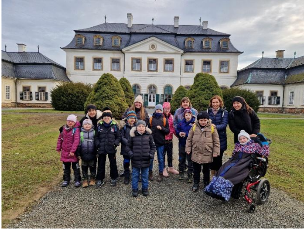
Náměšť na Hané