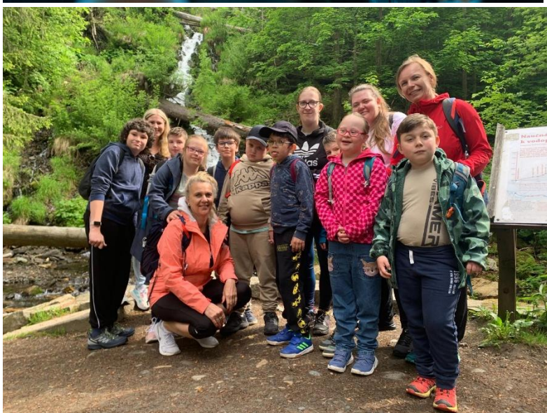
Turistický pobyt Dolní Údolí